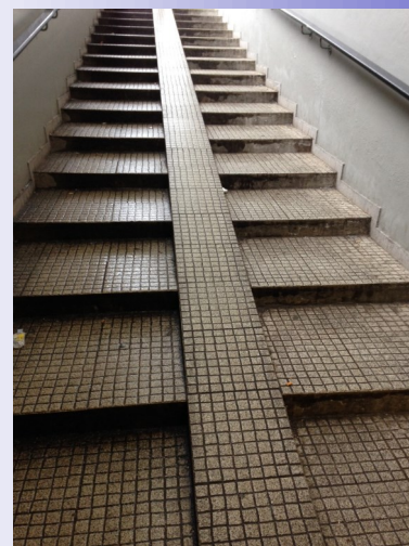
Nell'immagine la scala della stazione FS di Rogoredo a Milano

Peccato che in quel l'impegno sia mancata forse la volontà o la capacità di pensare che l'importante snodo ferroviario di Melegnano sarà sempre più frequentato da chi si muove in treno con la bici, dalle famiglie che useranno sempre più le linee suburbane per raggiungere la metropoli.